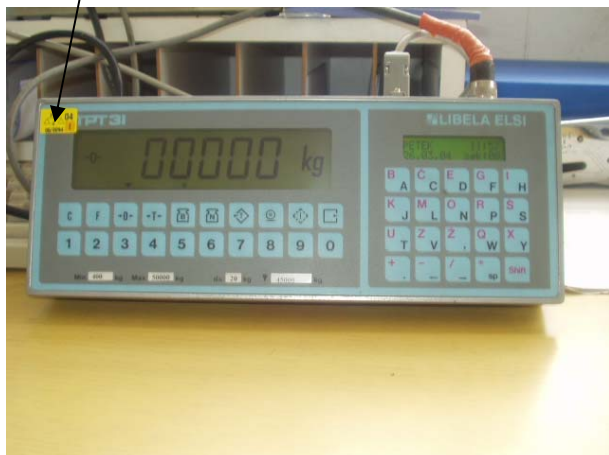
Ovjerni žig u obliku naljepnice